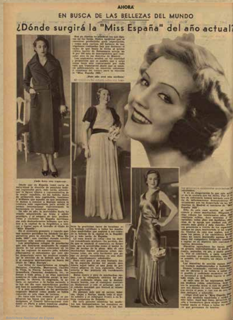
Biblioteca Nacional de España

La música en directo ambienta toda la obra en su época y crea una atmósfera reivindicativa.